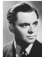
Jean Moulin, chef de la Résistance

Le principal souci des Français est le manque de nourriture parce que les Allemands récupèrent la majeure partie de la production agricole. Les mairies distribuent des tickets d'alimentation qui donnent droit à une quantité précise de pain, de lait, de viande, différente selon l'âge.