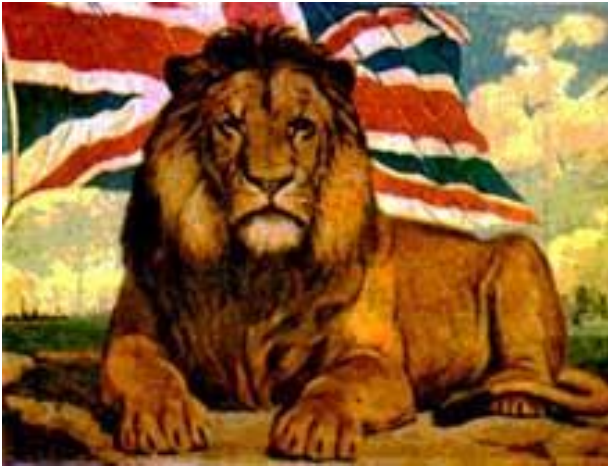
Le lion britannique, symbole de l'empire