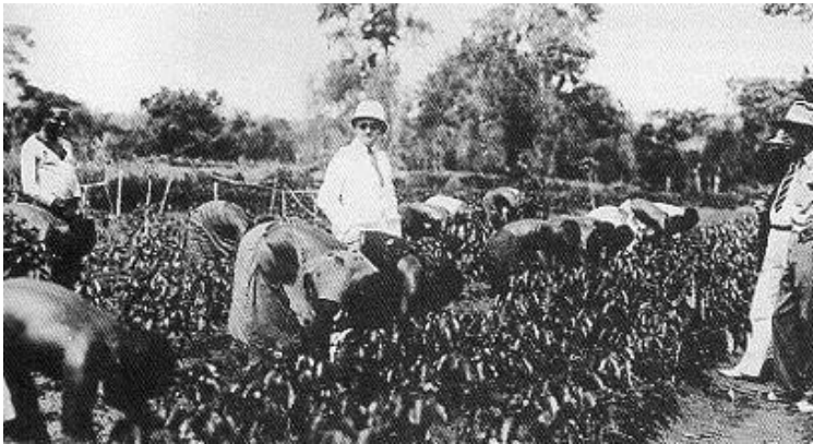
Exploitation de café au Cameroun

Les populations indigènes ne sont pas considérées comme étant à égalité avec les Européens, elles doivent travailler pour les colons et obéir aux lois qu'on leur impose. Les colons veulent civiliser les indigènes pour qu'ils deviennent comme eux.