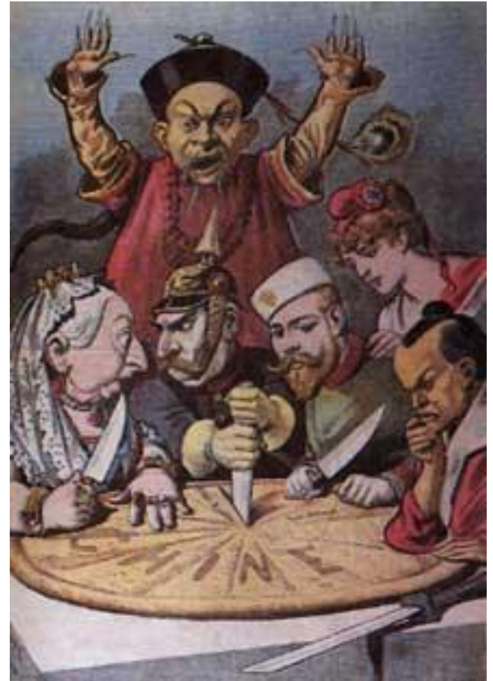
Les Européens se partagent la Chine.