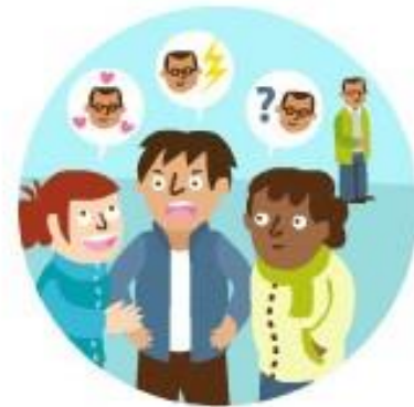
La liberté d'expression