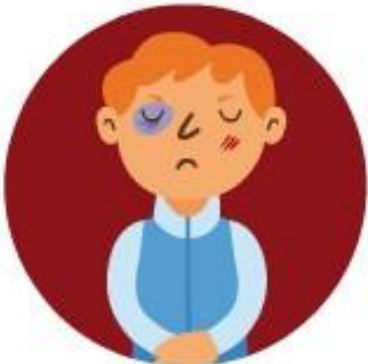
Les mauvais traitements