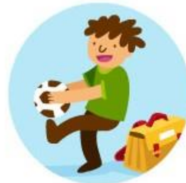
Le jeu et les loisirs