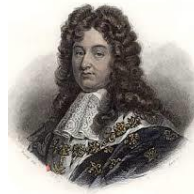
Louis XIV (le 14 ème )