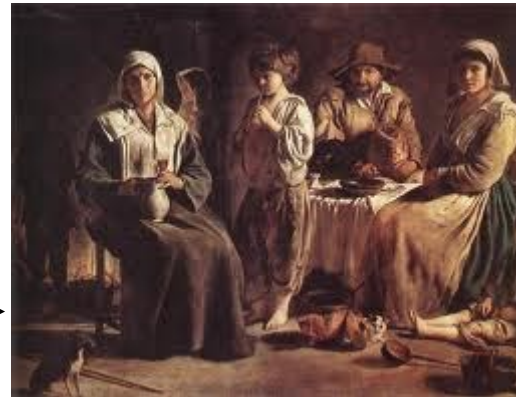
* le bas peuple : les paysans les plus pauvres.