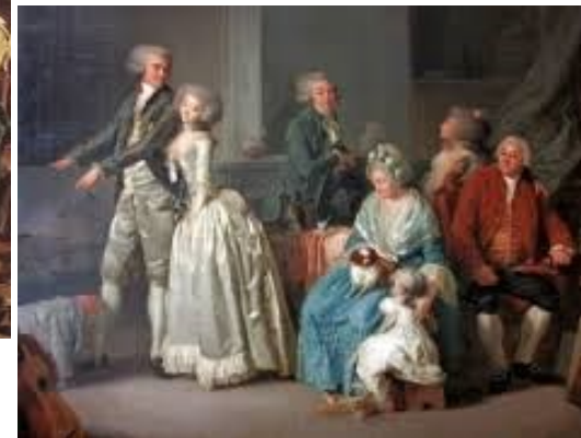
La famille Gohin, peinte par Louis Boilly, 1787.