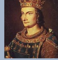
Philippe IV le Bel

Croisades Charité, Justice, Paix, Religion Université